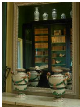
La grande bibliothèque vue dans le miroir