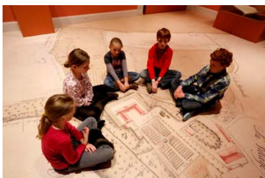
Salle de la baronnie