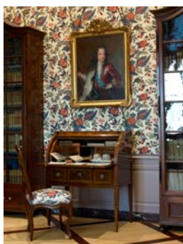
La petite bibliothèque