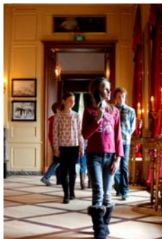
Enfilade et audioguide