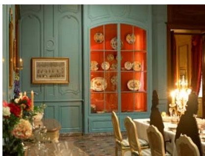
Table dressée et buffet dans la grande salle à manger