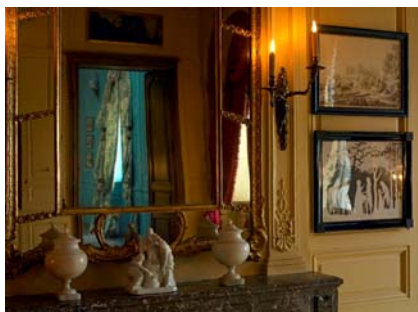
Détail du grand salon