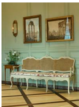
La petite salle à manger