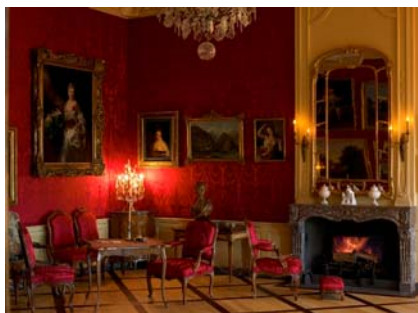
Le grand salon du château et sa tenture de damas cramois