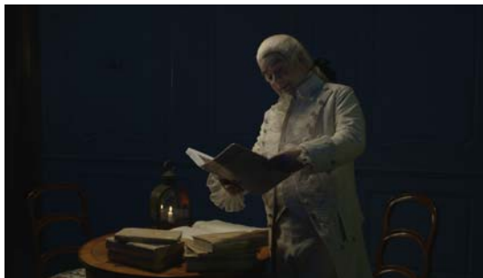
Extrait du film introductif de l'exposition