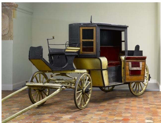
Char-de-côté utilisé dans le canton de Neuchâtel, entre 1870-1875