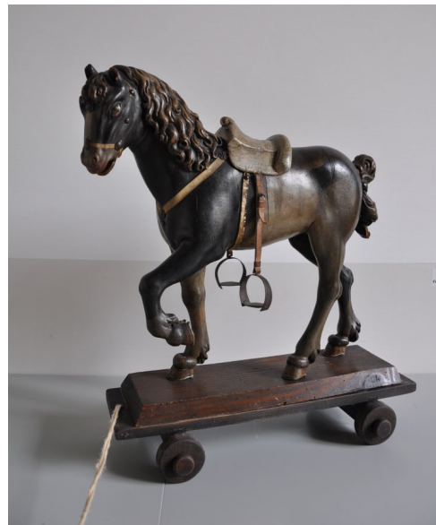
Jouet, première moitié du 18 e siècle, tilleul